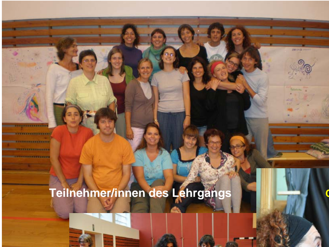
Teilnehmer/innen des Lehrgangs