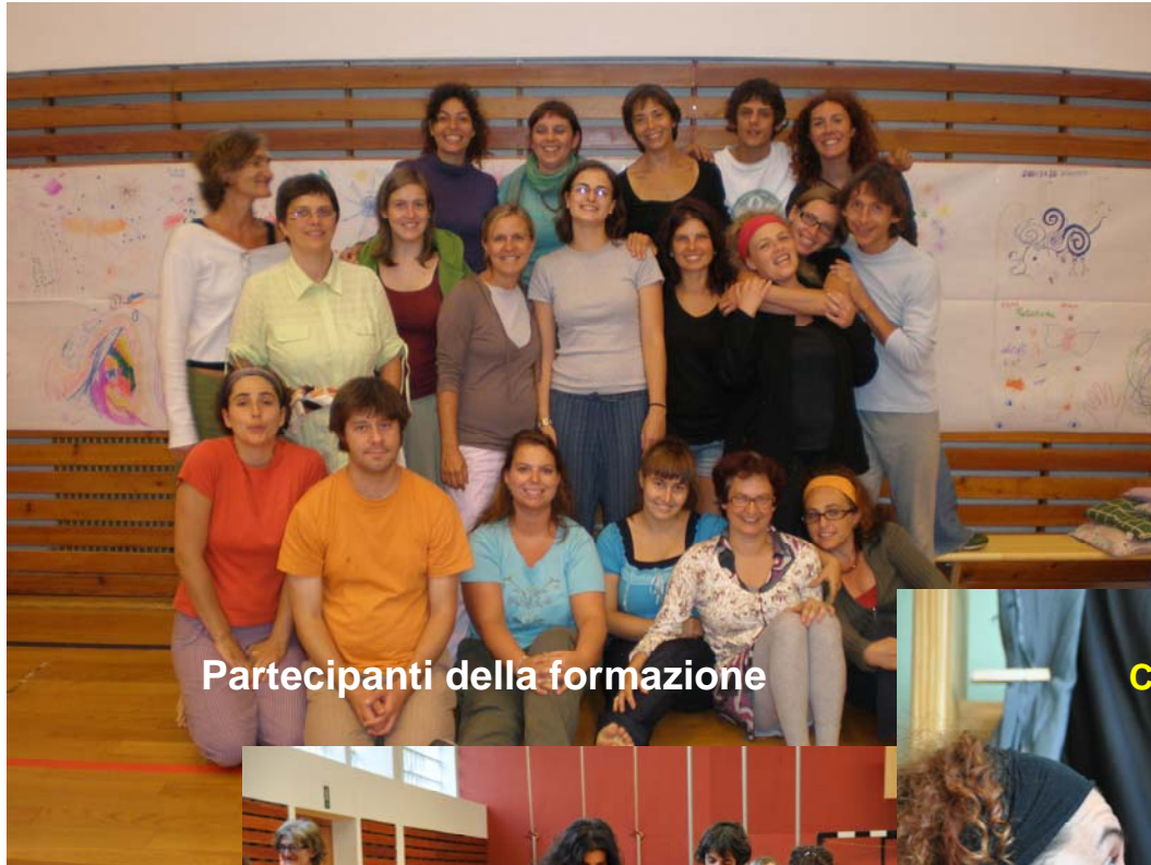
Partecipanti della formazione